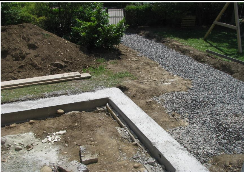
Unterbau für den Fußweg in Richtung Straße