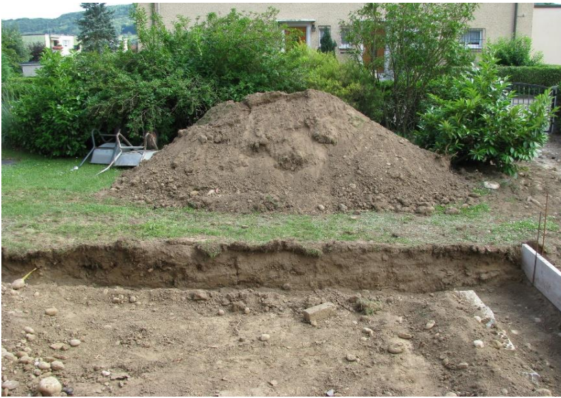
Fundamentgrabentiefe: 50 cm